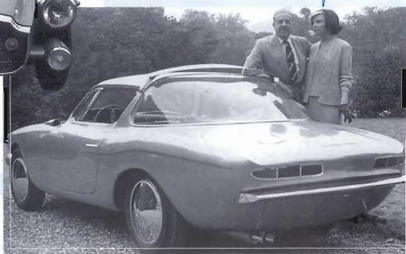
Sopra e a destra, due viste della Lancia Flaminia Coupé Loraymo. Si notano l'aletta aerodinamica sul tetto, i fanali posteriori a filo con la carrozzeria e il frontale con il bordo d'attacco dei parafranghi molto alto.

Fuori dalla serie, Zagato costruì alcune "special" concepite per le competizioni attorno a un telaio a struttura tubolare. Pur mantenendo invariata la linea, le "Sport Special" avevano un aspetto più "asciutto" in seguito alla esasperazione agonistica. Fra le fuoriserie ricordiamo poi