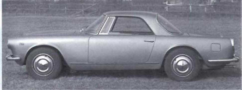
A sinistra, la Lancia Flaminia GT 2+2 Touring con il padiglione ampliato per aumentare l'abitabilità.