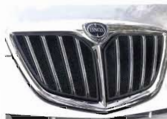
Sopra, la calandra introdotto nel 2007 nel modello Nuova Musa rinnovato in alcuni elementi. A destra, la coda della Lancia Musa m.y. 2007 con il nuovo portellone e le nuove luci a led.