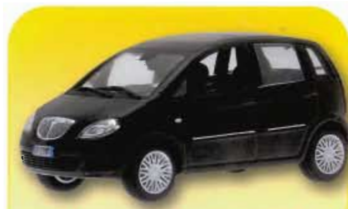
IL MODELLO DA COLLEZIONE

Nel frontale è arrivata la nuova calandra cromata con il nuovo logo Lancia; nella parte posteriore il generoso portellone è oggi più importante e assicura più spazio e maggiore accessibilità grazie alla soglia di carico abbassata di 4 cm.