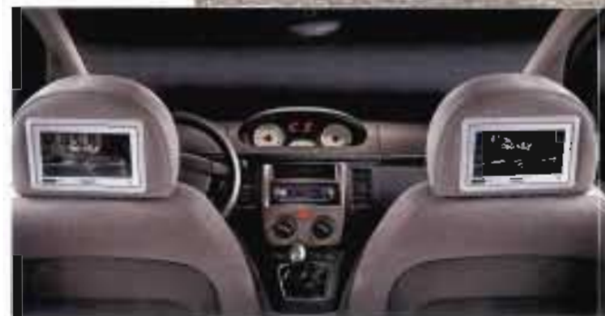
Sopra, gli schermi TV nei poggiatesta della Musa Sky.

Anche all'interno il design della Musa si avvantaggia della buona base offerta dalla Fiat Idea. Infatti i designer del Centro Stile Lancia hanno trovato una plancia con la strumentazione in posizione centrale, proprio come l'avevano immaginata per la loro Ypsilon. Il loro lavoro si è quindi concentrato sulla grafica degli strumenti e su quegli elementi connotativi con i quali l'utente viene a contatto, come il volante e il pomello del cambio. Inoltre la composizione della plancia ha dato loro la possibilità di giocare sui colori e sui materiali, creando aree più scure in alto e un inserto chiaro nella fascia centrale. Riguardo ai sedili, hanno mantenuto l'ossatura, della Fiat Idea, e hanno studiato schiumature specifiche che hanno