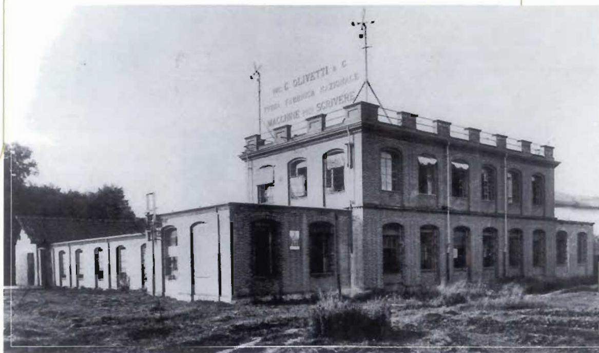
Lo stabilimento realizzato nel 1908 dalla Olivetti a Ivrea.

F in dai primi anni Venti, la crescita dei volumi produttivi determinata dalla domanda bellica aveva posto le imprese di fronte alla necessità di ampliare e migliorare la propria attrezzatura tecnica, perseguendo l'obiettivo di una maggiore efficienza produttiva attraverso una miglior organizzazione del lavoro nei diversi reparti. In tutte le maggiori imprese del comparto meccanico, e in quelle dell'automobile in particolare, furono sperimentati nuovi metodi di produzione di matrice americana, con uno sforzo costante in direzione della standardizzazione dei prodotti e dei loro componenti, e l'adozione di lavorazioni in linea. Una sfida alla quale la Fiat aveva risposto con la costruzione del modernissimo stabilimento del Lingotto, che fin nelle forme esterne e nell'impianto volumetrico aveva voluto essere un manifesto della modernità. Naturalmente l'adozione di nuovi moduli organizzativi aveva impegnato le imprese in un complesso lavoro di scomposizione e riorganizzazione dei vecchi metodi di lavoro, che mirava a ridurre i margini di autonomia di cui godevano i singoli capi-reparto a favore di una gestione accentrata dei processi produttivi, affidata a specialisti raccordati all'ufficio tempi e metodi, divenuto cuore dell'organizzazione aziendale.