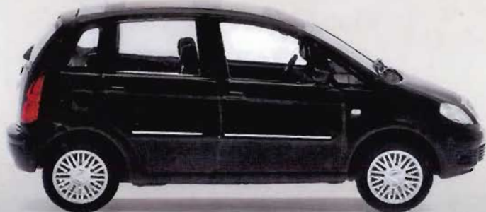
LANCIA MUSA - 2004