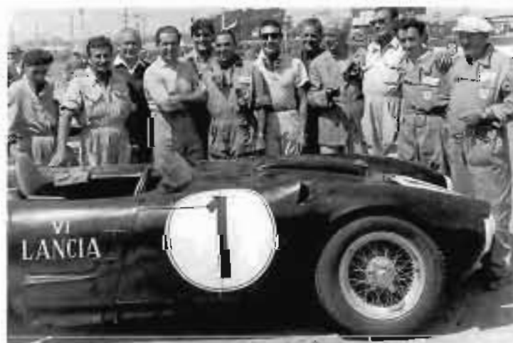
A destra, la Lancia D24 Spider Competizione di Eugenio Castellotti vincitore della gara in salita Aosta-Gran San Bernardo il 25 luglio 1954.

Sotto, a sinistra, 27 giugno 1954. I piloti Alberto Ascari, Eugenio Castellotti e Luigi Villorosi attorniti dai meccanici prima del Gran Premio di Oporto. La vettura numero 1 è quella di Villorosi che concluderà la gara con un ritiro per un guasto.