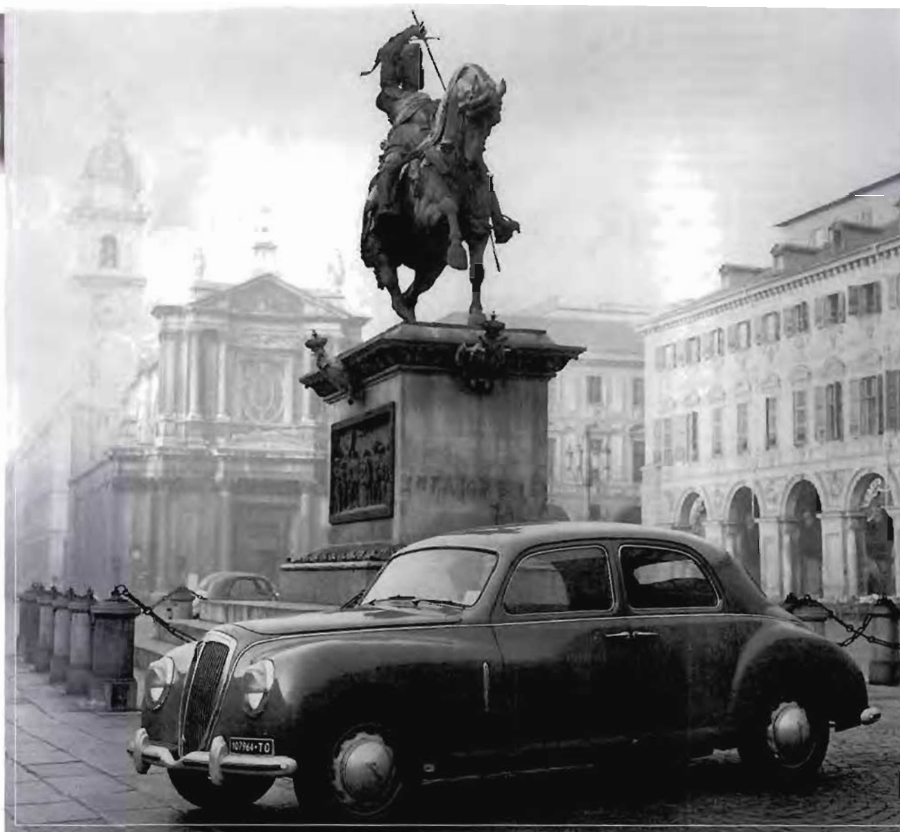
Sopra, una Aurelia B 10 in piazza San Carlo a Torino. Il primo modello Lancia del dopoguerra è ancora ben al di sopra degli standard del mercato di massa.

luppo di piccolissimi mezzi motorizzati, quali i cicli a motore, i motoscooters ed i motocicli di piccola cilindrata". La crescita quasi febbrile di questo settore aveva fatto emergere un serbatoio di potenziali acquirenti di automobili del tutto inimmaginabile solo pochi anni prima: "Sono migliaia, decine di migliaia di automobilisti in formazione, i quali senza dubbio dovranno passare dalla moto alla vetturetta".