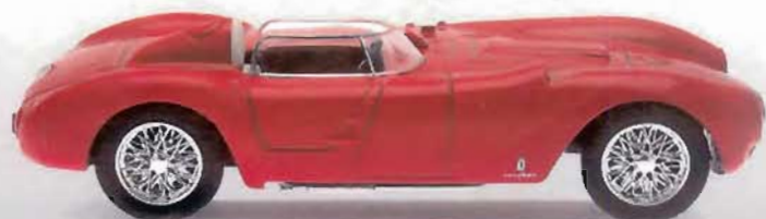
LANCIA D24 SPORT SPIDER - 1953