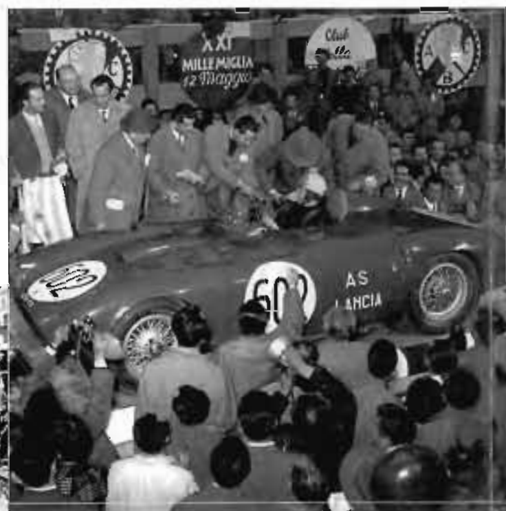
Sopra, la Lancia D24 Spider Competizione di Alberto Ascari alla partenza della Mille Miglia. Il 2 maggio 1954 il pilota milanese taglierà il traguardo vittorioso. A sinistra, 30 maggio 1954. La Lancia D24 Spider Competizione di Piero Taruffi lanciato a vincere la 38ª Targa Florio.

a 2,9 litri e l'impiego del compressore non risolsero il problema. La drastica decisione di "decapitare" la berlinetta D20 per ricavarne la spider D23 fu un altro consapevole palliativo in attesa della D24. Quest'ultima fin dall'origine ebbe la carrozzeria aperta biposto sport. Sebbene esteticamente simile al modello precedente, la D24 era quasi del tutto nuova. In pratica solo le sospensioni anteriori e i freni rimasero gli stessi. Il motore disegnato da Ettore Zaccone Mina mantenne 6 cilindri a V di 60°, quattro alberi a camme in testa e due candele per cilindro; ma per portare la cilindrata a 3284 cc, con l'alesaggio di 88 mm e la corsa di 90, dovette essere rivisto nelle fusioni del monoblocco e delle teste. Del tutto nuovi furono l'albero motore su sottili cuscinetti bimetallici Vanderwell, l'alimentazione