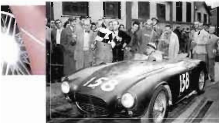
Sopra, 4 ottobre 1953. La Lancia D24 Spider Competizione di Eugenio Castellotti alla partenza della gara in salita Pontedecimo-Passo dei Giovi: a causa di un testacoda si classificò solo quinto.