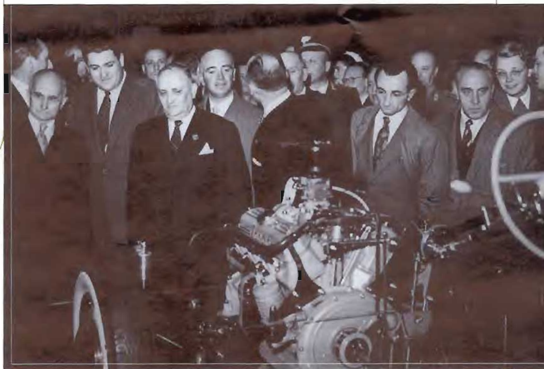
Salone dell'automobile di Torino, 1950. Da sinistra, il presidente della Repubblica Luigi Einaudi osserva, insieme a Gianni Lancia, il telaio sezionato della Lancia Aurelia.

Il presupposto di tale disegno, che se attuato avrebbe probabilmente ridefinito il profilo della Lancia, era una forte crescita del mercato, e in particolare della domanda di piccole vetture, negli anni a venire. A dare credito a questa